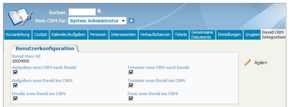
Einstellung zur Verknüpfung im Administratorbereich

Tobit David.fx ist eine Software für den Austausch von Informationen. Wir haben eine Schnittstelle entwickelt, mit der sich die Tobit-Informationen in Ihr Sage CRM-System übertragen lassen können (Ablage E-Mails/Fax, Abgleich Kalenderdaten).